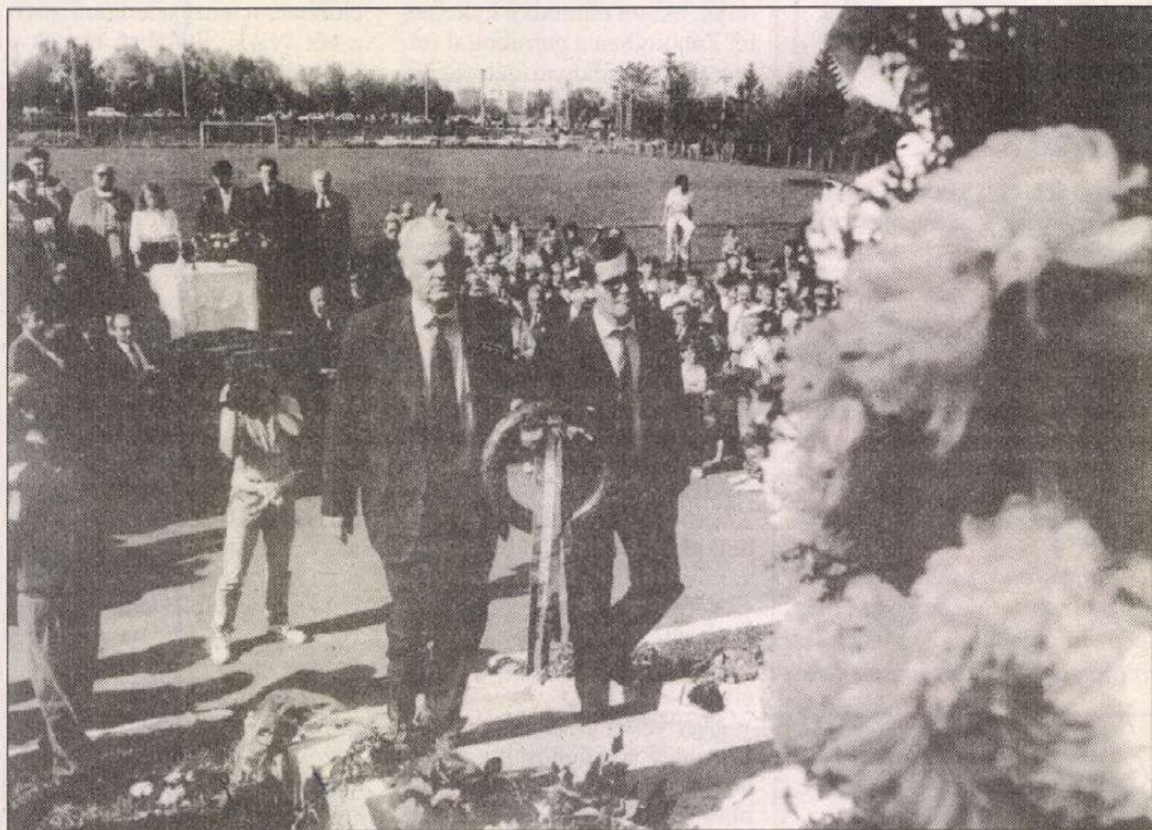
A Magyarok Világszövetsége képviselői koszorút helyeznek el az aradi emlékműnél