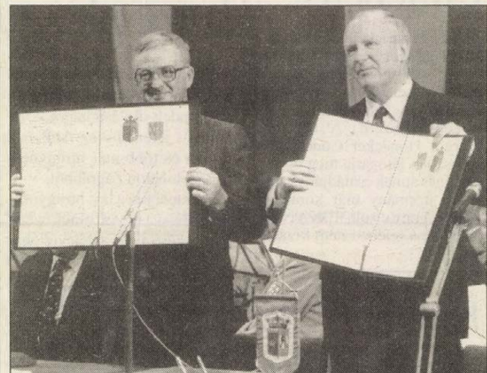
A megállapodás határozatlan időre szól és minden területre kiterjed

A határozatlan időre szóló, hosszú távú és minden területre kiterjedő megállapodást először (Folytatás a 3. oldalon)