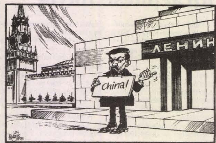
Tovább a lenini úton?

A királyi család a II. világháború elején Londonba menekült, ahol II. Karagyorgyevis Sándor is született. A herceg, aki most jár először Jugoszláviában, brit állampolgár és brit útlevelel érkezett Belgrádba. A herceg látogatását főképpen az ellenlélek sürgette: nem polgárjogi megfontolásokról, hanem azért, mert Sándor herceg jelenlétét politikai aduként kívánja felhasználni.